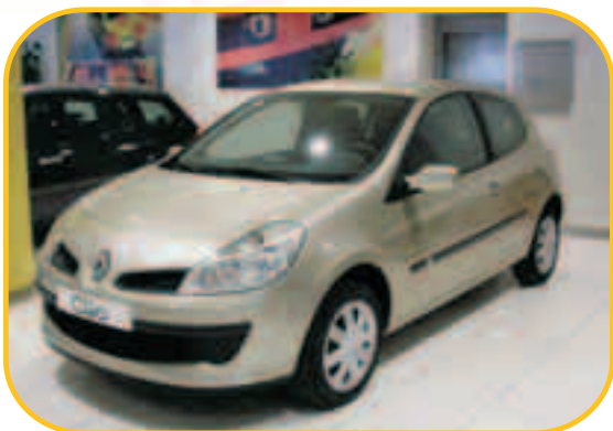
CLIO S.L. EMOTION 1.5 dci 70CV

PVP 16.000 € PVP ESPECIAL KMO 12.600 € AHORRO 3.400 €