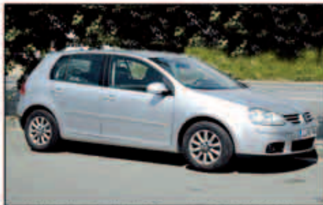
VW Golf, iGolf 1.6, 102cv. Año 2007, 19.000Km. Climatizador, conexión iPod, PVP: 16.000Eu.