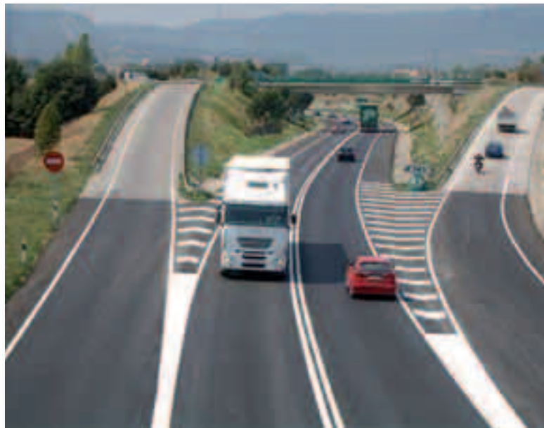
La concienciación ciudadana y las medidas adoptadas por la administración continúan reduciendo la siniestralidad