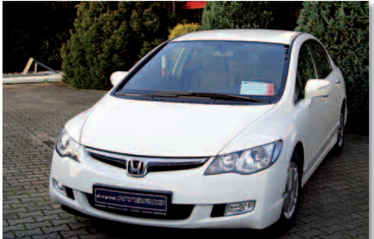
Honda Civic 1.3 Hybrid

Amb una potència de 115 CV, un consum mixt de 4,6 litres i un nivell baix d'emissions de CO 2 de 109 g/km, els vehicles híbrids adquirits tenen dos motors, un de gasolina