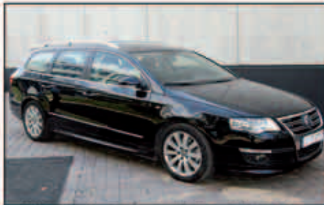
VW Passat Variant Acabado R-Line 2.0TDI, 140cv. Año 2008, Xenon, 5.500Km PVP: 29.900Eu.