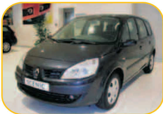
GRAND SCÉNIC BUSINESS 1.5 dci 105CV

PVP 16.000 € PVP ESPECIAL KMO 12.600 € AHORRO 3.400 €