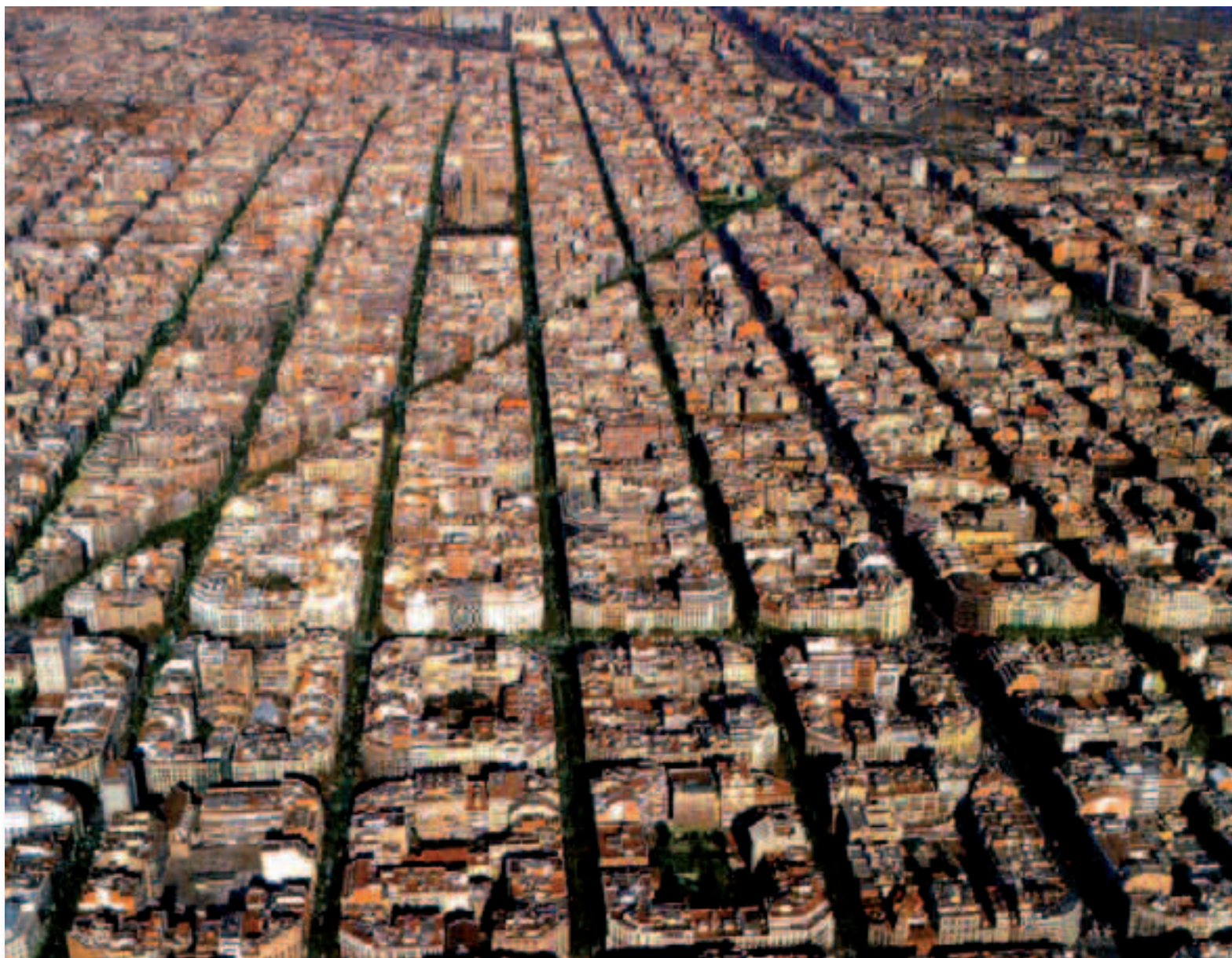
Los cruces más peligrosos de Barcelona contarán con cámaras para disuadir a los infractores

Al señalar la existencia de estas cámaras en las intersecciones, el sistema se convierte en un elemento disuasorio