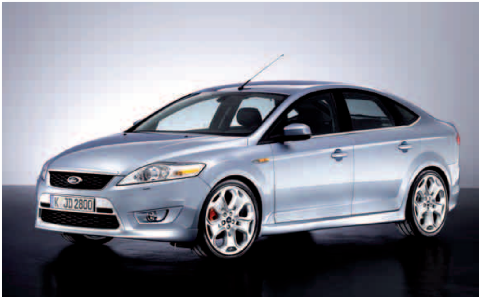
El Plan Vive entró en vigor el 31 de julio para incentivar la compra de coches nuevos

El Vive contempla ayudas a la financiación de la compra de un automóvil nuevo mediante créditos blandos