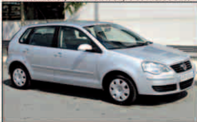
VW Polo Edition 1.4, 80cv. 5vel. Año 2007 Solo 15.000km, PVP Oferta: 10.000Eu.