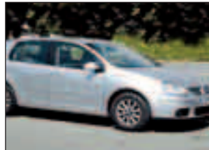
VENDO VW Golf, iGolf 1.6, 102cv. Año 2007, 19.000 km. Climatizador, conexión iPod. Precio: 16.000 €. Tel.: 93 640 00 72