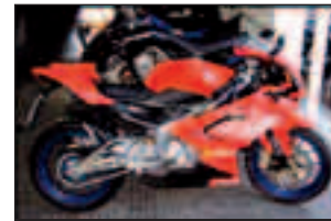
Vendo APRILIA RS 125. Año 2008, 4000km. Extras, kit de potenciación, escape. Estado impecable. Limitada de potencia. Precio: 3500 € Tel. 936382010