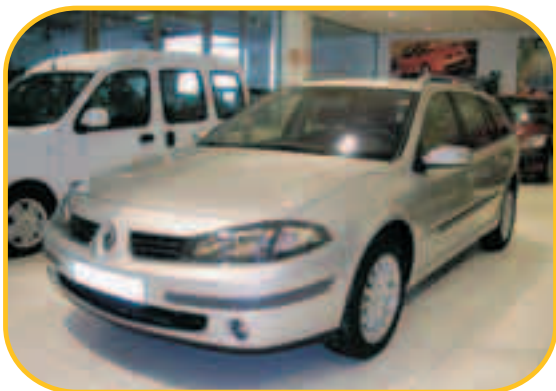
LAGUNA GRAND TOUR EXPRESSION 1.9 DCI 130CV

PVP 28.540 € PVP ESPECIAL KMO 19.900 € AHORRO 8.640 €