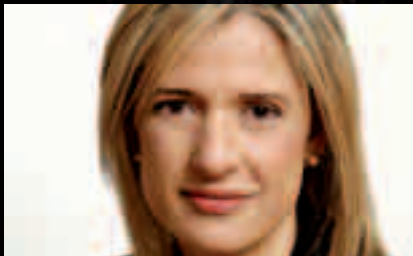
Entrevista amb l'Alcaldessa d'Esplugues de Llobregat. Pág. 6-7