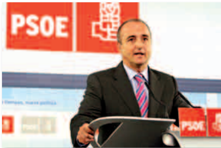
Miguel Sebastián, ministro de Industria, Turismo y Comercio

En principio, el plan se ha planteado con dos años de vigencia, pero se agotará cuando se acaben los 1.200 millones de euros presupuestados