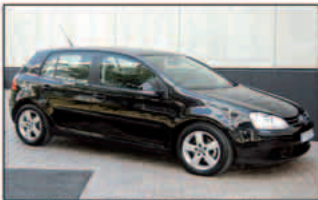
VW Golf Sportline DSG 6v. 2.0TDI, 140cv. Año 2007, 15.000Km, clima, PVP: 21.000Eu.

Ctra. Santa Creu de Calafell, 31 08830, Sant Boi T. 936400072 vo@carhaus.volkswagen.es