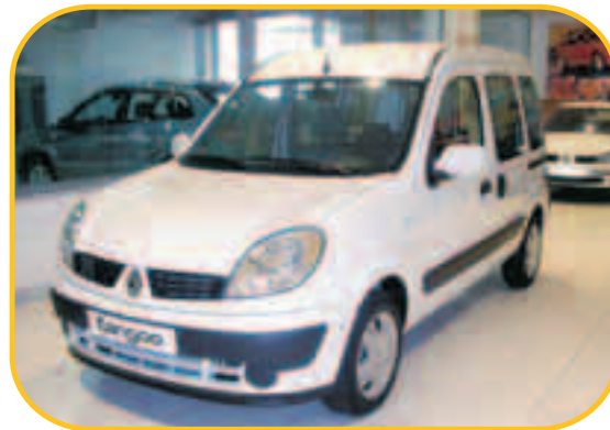
KANGOO COMBI CONFORT EXPRESSION 1.5 85CV

PVP 25.385 € PVP ESPECIAL KMO 18.500 € AHORRO 6.885 €