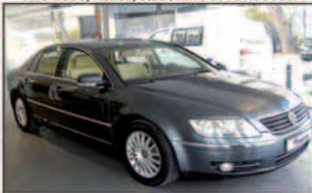
VW Phaeton V6 3.0TDI 4Motion, 233cv. Año 2007 Tiptronic, piel, Xenon, 10.000km PVP :55.000Eu.

Vehículos totalmente revisados - Garantía europea hasta 2 años - Asistencia 24 Horas - Prueba sin compromiso