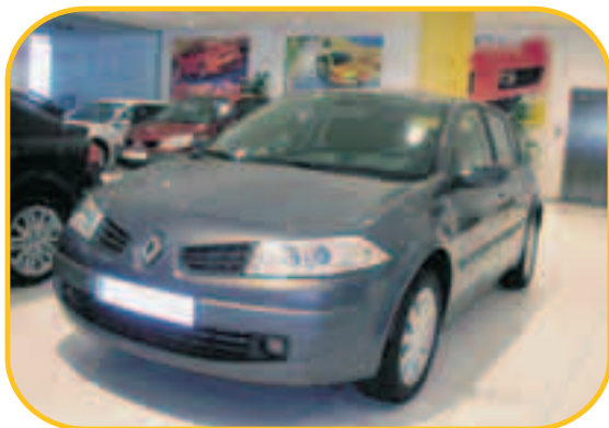
MÉGANE BERLINA DYNAMIQUE 1.9 dci 130CV

PVP 28.540 € PVP ESPECIAL KMO 19.900 € AHORRO 8.640 €