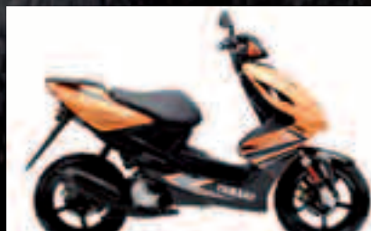
La nueva normativa de ciclomotores vigente desde el 1 de septiembre. Pág. 12