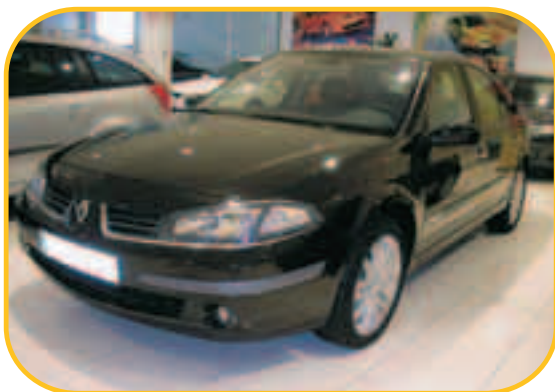
LAGUNA BERLINA DYNAMIQUE 2.0 150CV

PVP 25.950 € PVP ESPECIAL KMO 18.900 € AHORRO 7.050 €