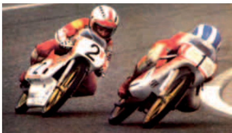
Ricardo Tormo conduce la Bultaco número 1 durante una carrera

El pulso entre los dos catalanes por los campeonatos de España y del Mundo se mantendrá hasta el final