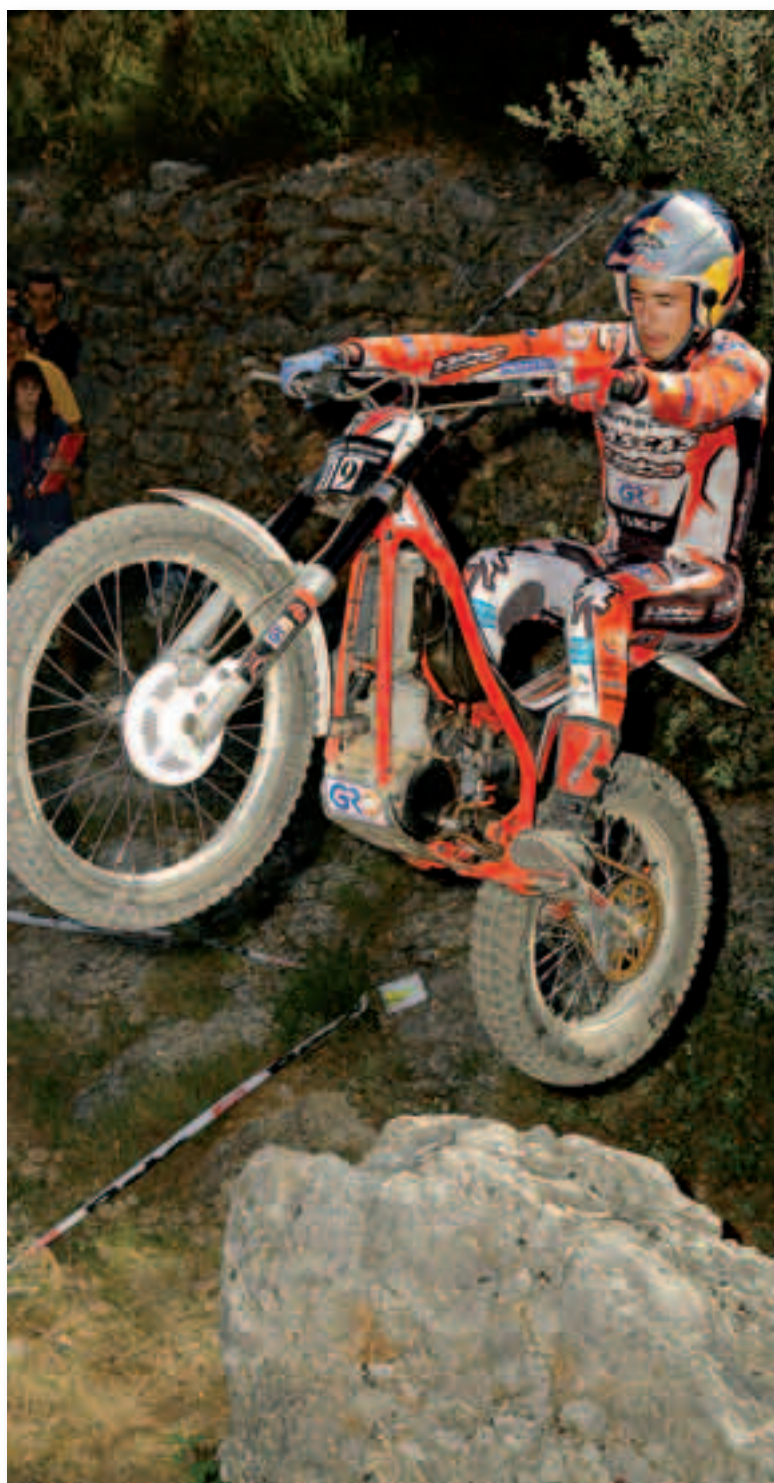
Adam Raga, durante una de las pruebas del mundial 2008.