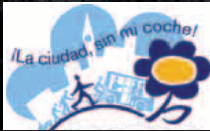
Semana Europea de la Movilidad. Pág. 11