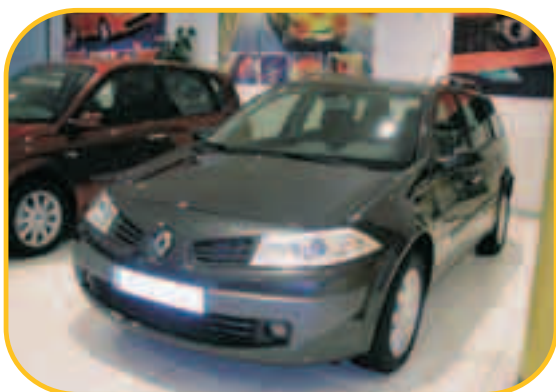
MÉGANE GRAND TOUR DYNAMIQUE 1.9 dci 130CV

PVP 20.300 € PVP ESPECIAL KMO 13.500 € AHORRO 6.800 €