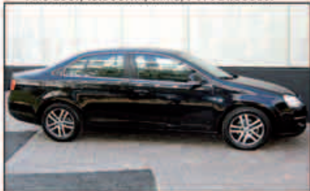
VW Jetta Advance 1.9TDI, 105cv. Año 2007 Llantas al. climatizador bizona, PVP: 19.500Eu.