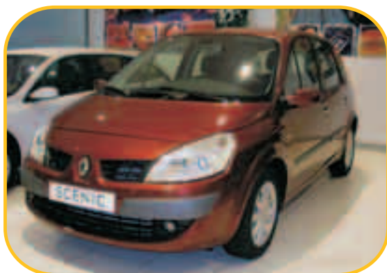
SCÉNIC DYNAMIQUE 1.9 130CV

PVP 24.100 € PVP ESPECIAL KMO 18.400 € AHORRO 5.700 €