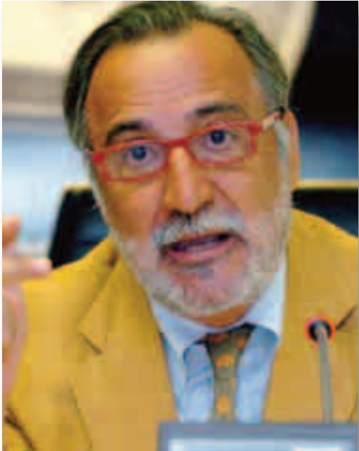
Pere Navarro, director general de Tráfico

Las multas no distinguen crisis de tiempos de bonanza económica. El director general de Tráfico, Pere Navarro, ha descartado que la DGT se planteé sustituir las sanciones económicas por cursos de educación vial u otras medidas en el caso los parados de larga duración, de manera que se reduzca el impacto de las infracciones en los gastos de estas personas.