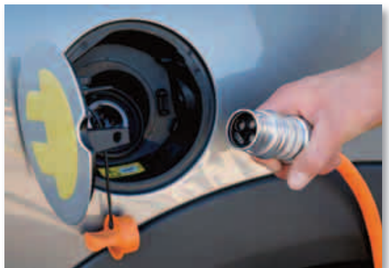
Una toma trifásica con una tensión de 400 voltios es el 'cargador universal' para todos los vehículos en todos los países