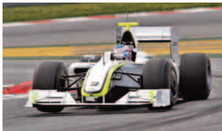
El británico Button es el gran favorito para hacerse con el Mundial de pilotos 2009

Puestos a superar su excelente comienzo de año, sólo dos pilotos en estos 60 años de historia reali-