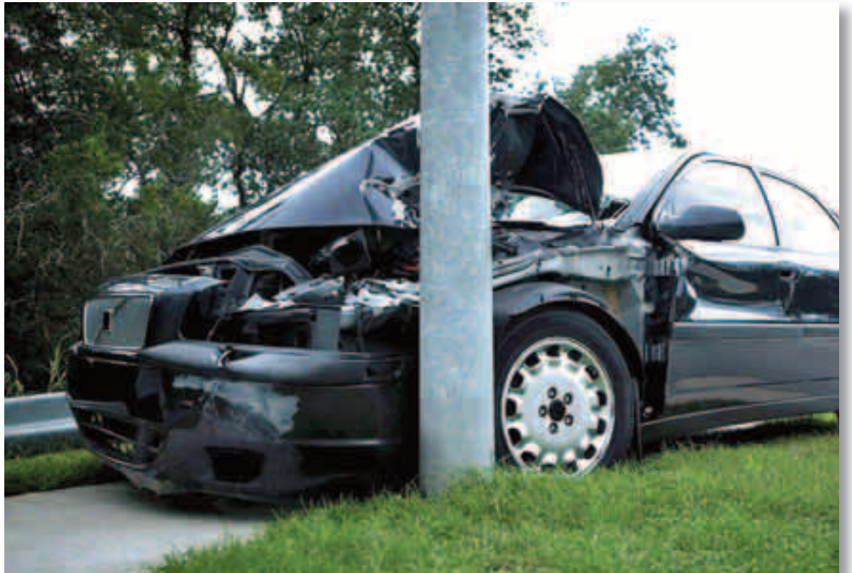
La falta de horas de sueño es una de las principales causas de los accidentes de tráfico.

Los españoles son los europeos que menos duermen