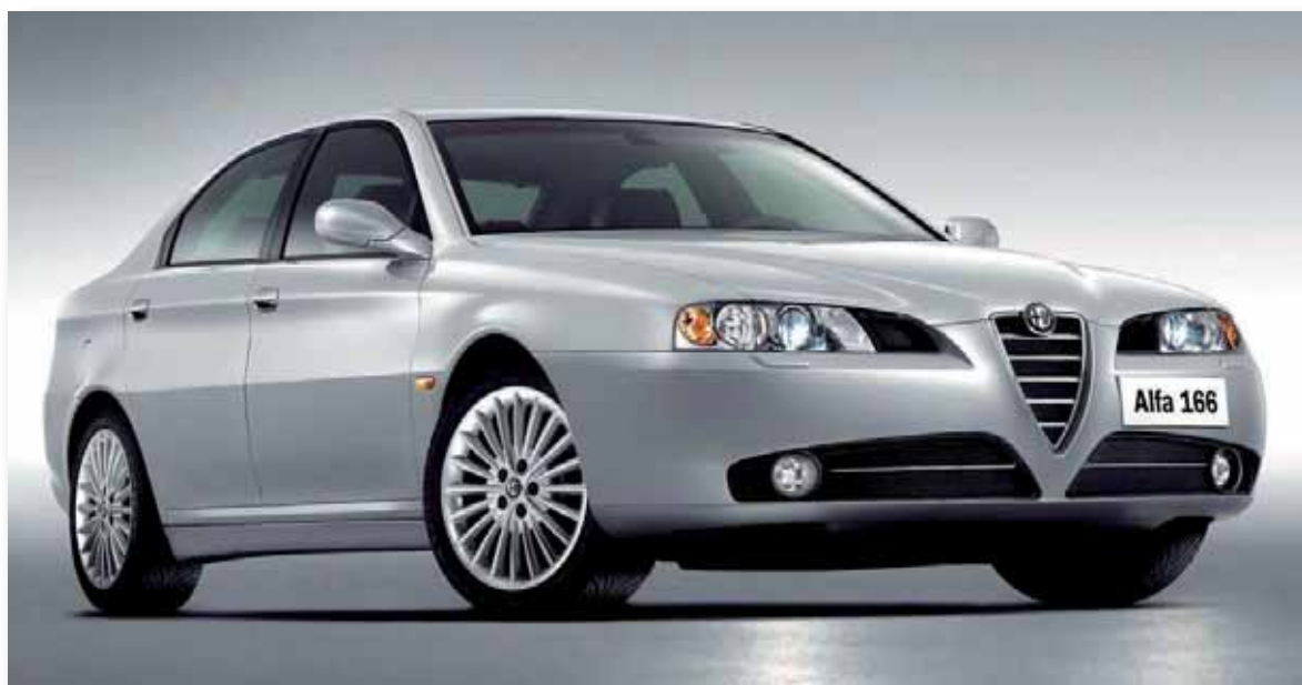
Los plateados están entre los que sufren menos accidentes

Ser hombre o mujer también es un factor determinante a la hora de elegir color. Así, los hombres prefieren mayoritariamente los coches oscuros, frente a las mujeres que optan por colores más claros. Pero, atención, en el caso de compartir coche, el informe constata que el hombre es capaz de elegir tonos más claros sólo por complacer a su pareja.