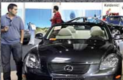
El Salón Ocasión de Barcelona promueve la compra inteligente. Pág. 3

Apuesta por el diseño y la ecología presentando entre otros el Buick Riviera, un coupe de bajo consumo y diminutas emisiones contaminantes (pág 6)