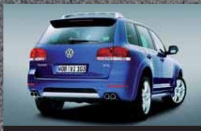
Según un estudio, las mujeres prefieren coches claros. Pág. 8