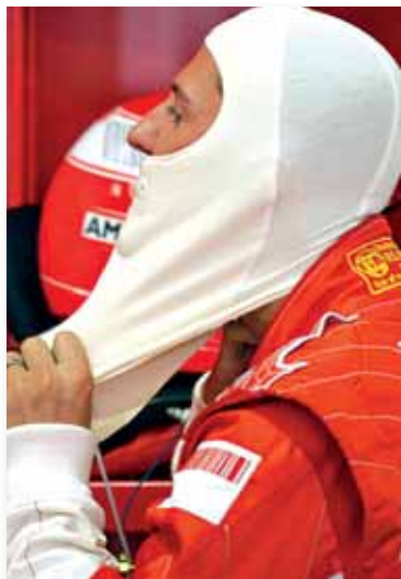
Schumacher se prepara antes de salir a pilotar en Montmeló

Con la puesta en práctica de la novedad técnica de la temporada que viene -los coches no llevarán instalado el control de tracción, con lo que el control del vehículo en las curvas dependerá aún más del piloto- el alemán demostró que sigue estando en la primera fila competitiva más de un año después de su retirada. Participó en dos de los tres días de entrenamientos y en ambos se impuso. En el tercero, al káiser le relevó su