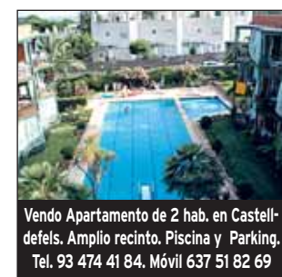
Vendo Apartamento de 2 hab. en Castelldefels. Amplio recinto. Piscina y Parking. Tel. 93 474 41 84. Móvil 637 51 82 69