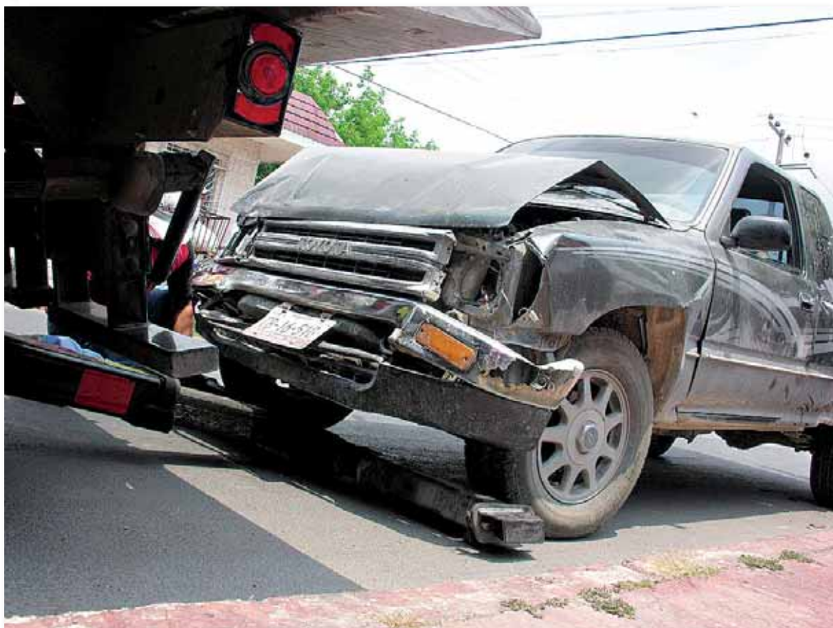
Los accidentes de tráfico dejan al año en el mundo 50 millones de heridos