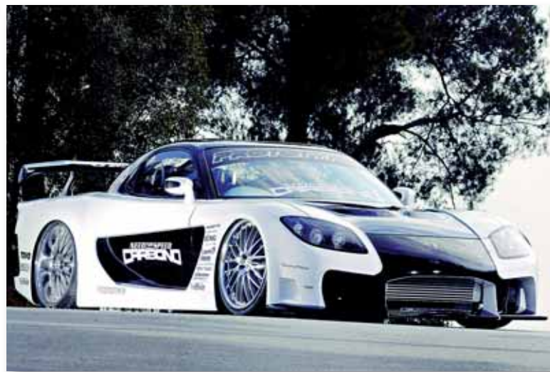
Un dels protagonistes de l'edició de 2006, tret del videojoc Need For Speed

Organitzat per Fira de Barcelona i el grup editorial MotorPress Ibèrica, la nova edició del BTS se celebrarà en el palau 1, 2 i Plaça Univers del recinte firal de Montjuïc. El saló, el primer que va néixer a Espanya dedicat al món de la personalització, reunirà les últimes novetats del tuning, una afició que durant els darrers anys ha crescut de manera espectacular.