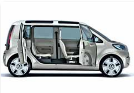
Spaceup Blue de Volkswagen

Se trata de una 'van' compacta sin ningún tipo de emisiones. A bordo: el primer generador eléctrico, una serie de doce pilas de ion de litio. Cuando el motor eléctrico (45 kws / 61 PS) del Volkswagen Space Up Blue se pone en marcha exclusivamente por la batería, es posible llegar a los 100 km/h, suficiente para manejar casi todas las distancias del centro de la ciudad.