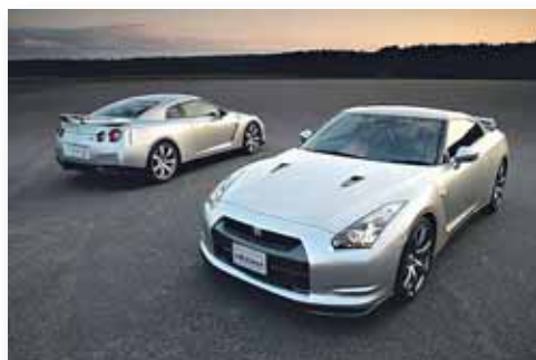
Nissan GT-R 2009

E l Salón de Los Ángeles, celebrado del 16 al 25 de noviembre, es la última gran cita norteamericana del año y se ha convertido en la antesala de la principal muestra de los Estados Unidos: Detroit. En esta exhibición los fabricantes estadounidenses 'juegan' en casa, con un gran despliegue de novedades que este año se han centrado en la presentación de modelos de motor híbrido y en el diseño futurista de los prototipos. Estas han sido las principales novedades de las marcas presentes en el certamen: