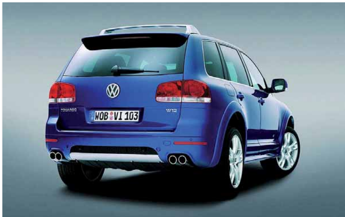
Los optimistas se decantan por los colores metalizados

El hombre es capaz de elegir tonos más claros sólo por complacer a su pareja