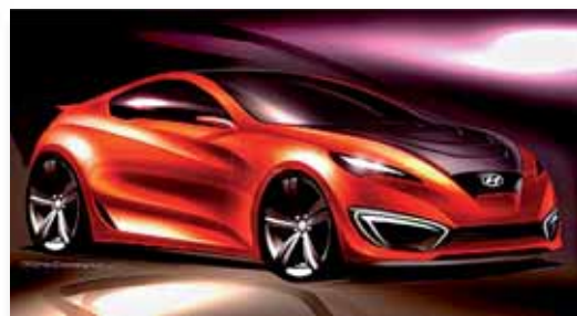
Hyundai Genesis Sport Coupé