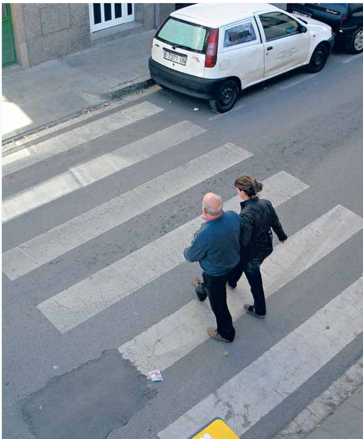
Los pasos de peatones son una de las marcas viales menos respetadas por los conductores

nes de los conductores por no respetar los pasos de cebra. De hecho, el comportamiento habitual de los conductores en este cruce era saltarse el semáforo con el muñequito en rojo.