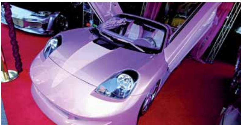
Vehicle utilitzat a la pel·lícula 'Yo soy la Juani' exposat l'any passat

Entre el públic que visiti el saló se sortejarà a més un cotxe tuning de luxe corresponent al projecte de la revista Maxi Tuning 2007.