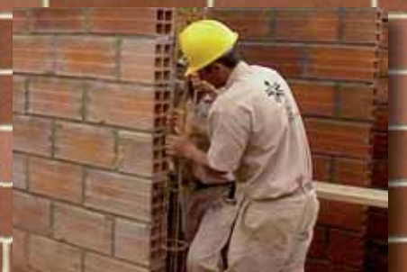
CONSTRUCCIONES EN GENERAL

Calidad, Eficacia, Seriedad y Solvencia Presupuestos sin compromiso