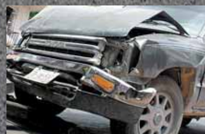
El mundo recuerda a las víctimas de los accidentes de tráfico. Pág. 14