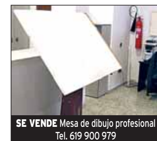
SE VENDE Mesa de dibujo profesional Tel. 619 900 979

t/casa y trno. 600 m2. Precio 360.000 € Negociables. Tel. 626 55 20 54 • SE TRASPASA O SE VENDE BAR EN PLENO FUNCIONAMIENTO EN MARTORELL CENTRO, entre estación de RENFE y Ferrocarrils Catalans. Por no poder atender. Superficie 180 m2, cocina, barra, salón, terraza, almacén (50 m2 adicionales), totalmente equipado. Caja demostrable. Precio negociable. Opción a acceso a la vivienda en la 2a. planta (90 m2). Ven a verlo! Tel. 93 774 15 79 - 692 17 05 24