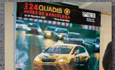
Las 24 Horas Quadis, más nocturnas que nunca. Pág. 18