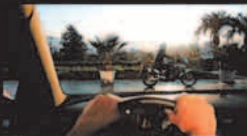
Visión con gafas Polaroid®

Si utilizas unas gafas Polaroid® te aseguramos: