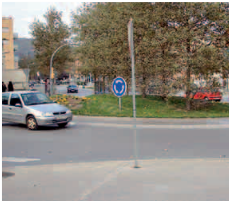
Las rotondas regulan cruces peligrosos sin necesidad de semáforos

Madrid, Barcelona y Valencia, las ciudades con más rotondas