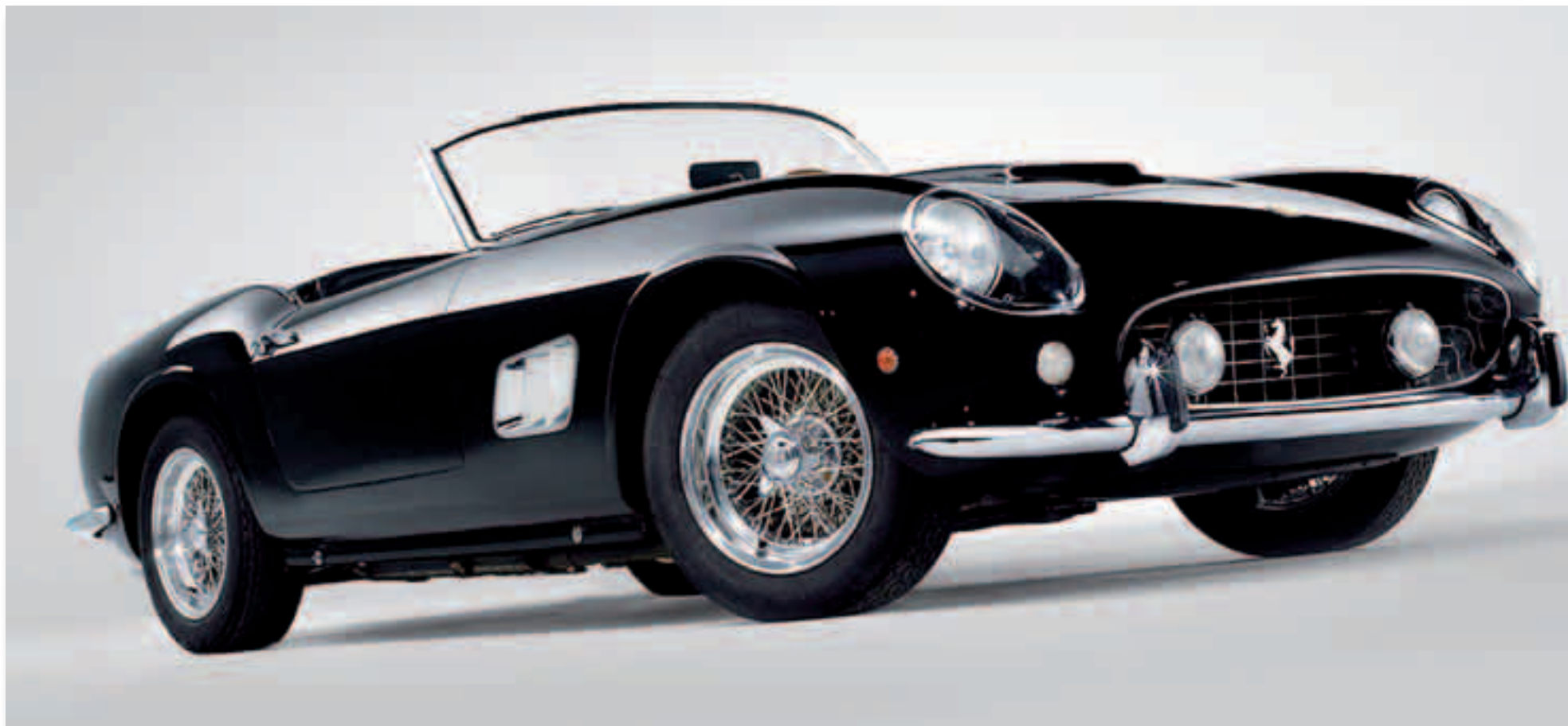
Ferrari 250 GT SWB California Spyder de 1961

Se trata del 250 GT SWB California Spyder de 1961