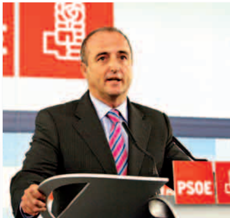
Miguel Sebastián, ministro de Industria

nistrados por Aniacam, la asociación de importadores de vehículos, tienen el doble de posibilidades de sufrir un accidente que un automóvil moderno y, por otra parte, contaminan un 80% más que los automóviles equivalentes de más reciente fabricación.