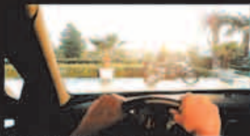
Visión sin gafas Polaroid®