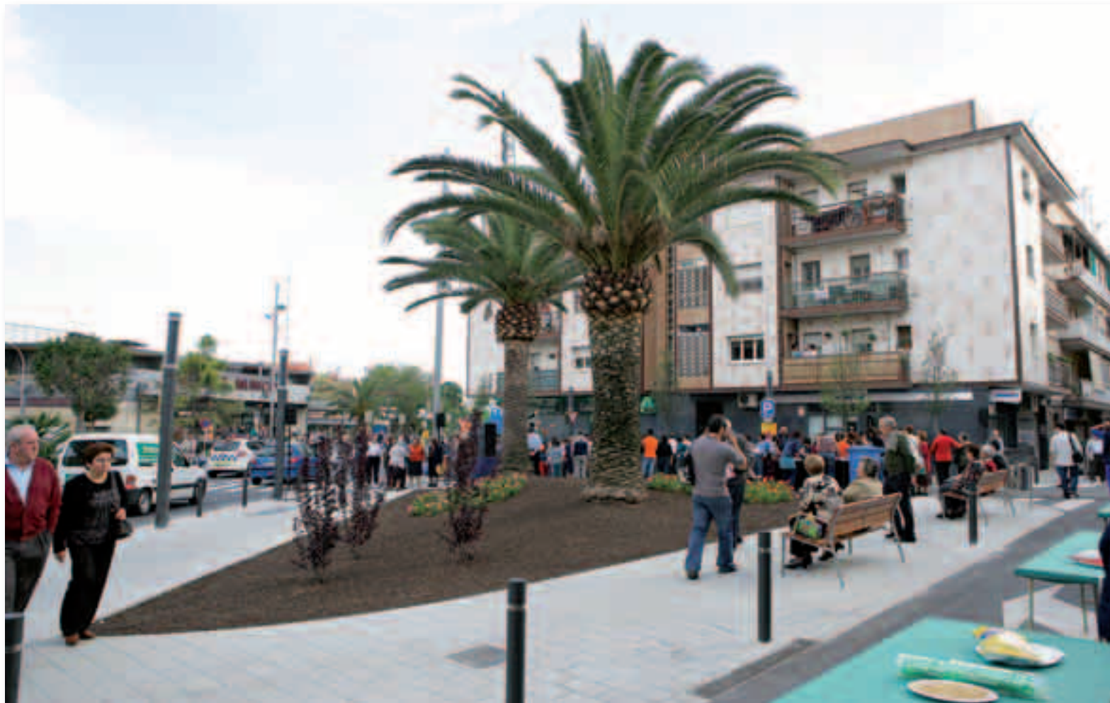
La Plaça d'Espanya, recentment remodelada

Bé, jo no diria que Sant Joan Despí estigui saturada de cotxes. Patim els efectes de la circulació de vehicles, com a totes les grans ciutats, però el trànsit és generalment fluid. Ara bé, com deia abans, el nostre objectiu és aconseguir que l'impacte del vehicle sigui cada vegada més petit per al vianant. Per això cada any remodelem algun carrer, en un procés continuat i amb el qual engrandim voreres, suprimim barreres arquitectòniques, millorem l'enllumenat, etc. Després d'Extremadura i la plaça d'Espanya, ara estem treballant al carrer Torrent d'en Negre, al Centre, i després seguiran uns altres: Jacint Verdaguer, Llobregat, Domènec, Joan Maragall i Sant Francesc d'Assís, entre d'altres. A la vegada, treballem en la posada en funcionament dels anomenats 'camins escolars', per potenciar que, amb tota seguretat, els nens i les nenes puguin recuperar l'hàbit d'anar caminant a l'escola.