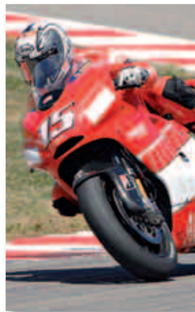
Sete Gibernau volverá a subirse a una Ducati