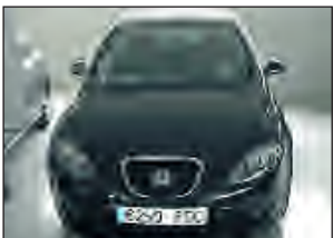
ALTEA 2.0 TDI DSG STYLANCE-NEGRO MAGI-AÑO 2006-FULL EQUIP-PRECIO 23.758 € TEL. 93 773 56 14

ALFA ROMEO 146 JTD. Año 2001. Precio: 6.000 € . Tel. 93 471 24 25