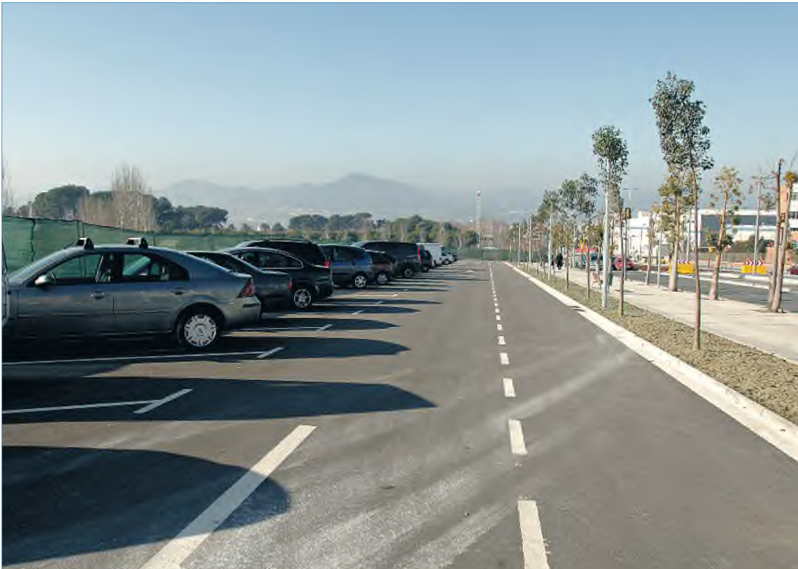
Aparcament situat al costat d'una estació de Trambaix ubicada a Sant Just Desvern

ser conscients del problema del transport i de la mobilitat.