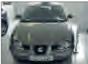
IBIZA 1.4 TDI 70 CV. GRIS SOMBRA-AÑO 2006- A,DA,EE,CC,RC,ABS,AIRBAGS-PRECIO 9900 € TEL. 93 773 56 14

AUDI A6 AVANT 2.5 TDI 163 CV. Gris Plomo. Año 2003. Precio : 20.900 € el. 93 637 90 65