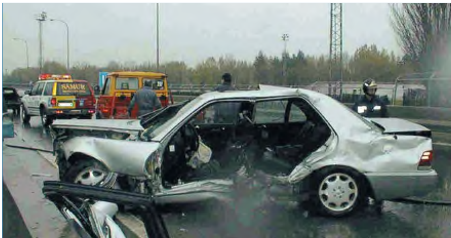
El coste por víctima morta del un accidente de tráfico ronda el millón de euros

Por último, el informe propone una serie de medidas encaminadas a frenar esta lacra, como la elaboración de un Pacto entre la sociedad y el Estado, la inclusión de la educación vial en el currículum escolar y la realización de campañas de concienciación dirigidas a los jóvenes.