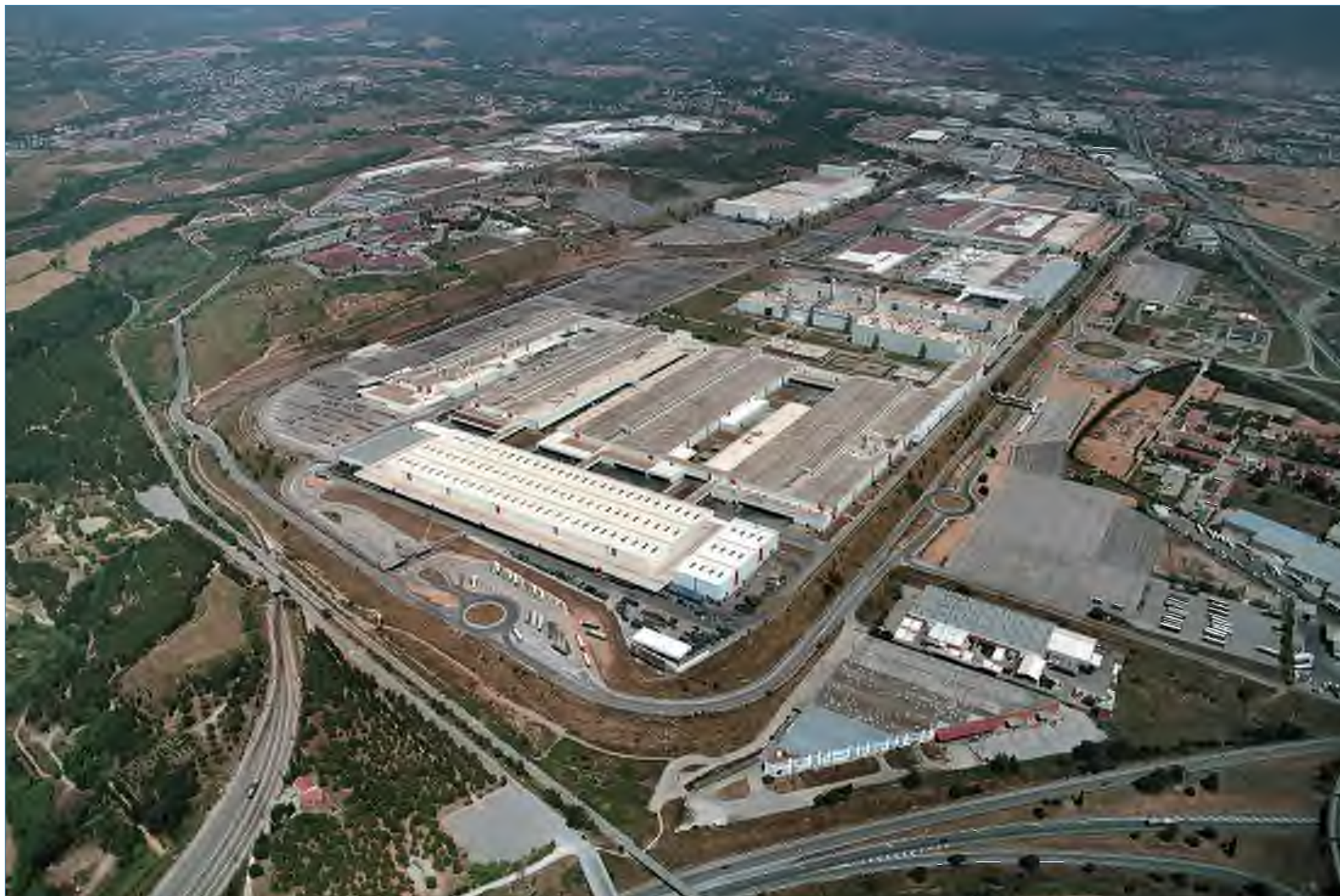
La fábrica de Seat, en Martorell.

L a mala racha en las ventas de Seat sigue teniendo consecuencias en la producción. La dirección de la empresa y