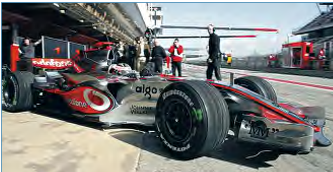
Alonso sale del box de McLaren al volante del MP4-22 para pilotar en Montmeló.