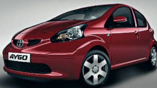
Model: AYGO SOUND 5P SP 1.0 VVT-i amb A/C, ràdio CD i ABS Matriculat l'any: 2006 Preu: 7.690 €