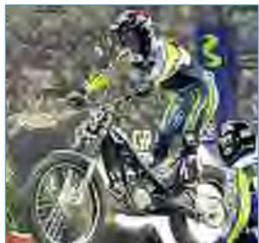
Cabestany destacó, pero no pudo llegar al podio