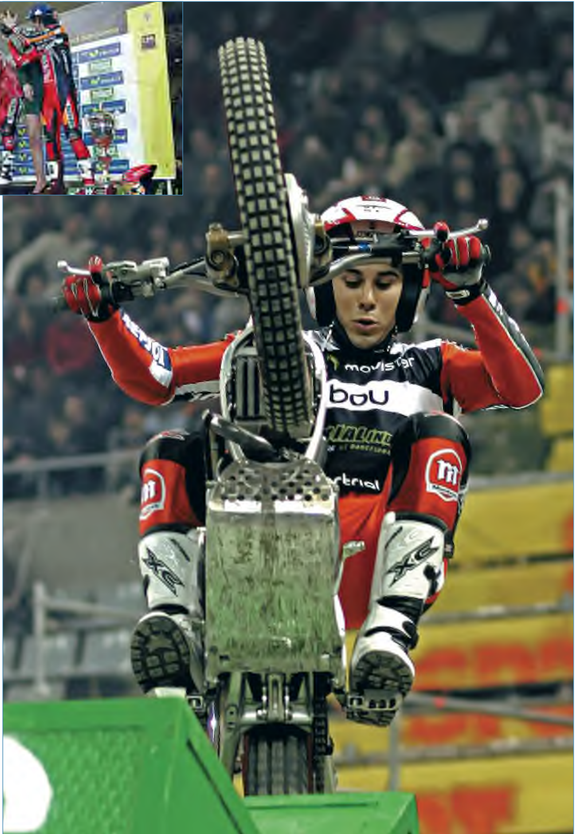
Toni Bou es cada vez más líder del Mundial