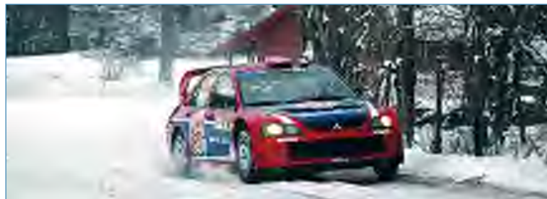
Xevi Pons, en acción con su Mitsubishi en la primera etapa del Rally de Noruega

Los rallies nórdicos siguen siendo coto privado de los pilotos escandinavos