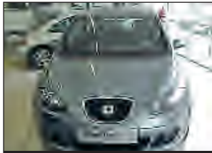
ALTEA 1.6 102CV .AZUL LLUVIA-AÑO 2004-AADAEECCRC,ABS,AIRBAGS-PRECIO 12.900 € TEL. 93 773 56 14

AUDI A8 S8. Año 98. Full Equip. Precio: 15.000 €. Tel. 93 471 24 25