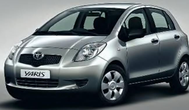
Model: YARIS 1.3 5P, YARIS amb A/C, ràdio CD i ABS Matriculat l'any: 2006 Preu: 9.900 €