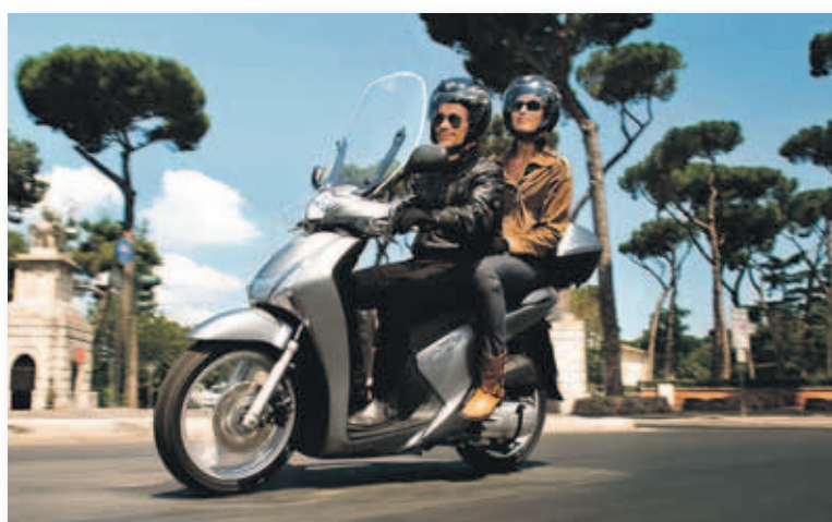
Barcelona lidera la venta de motocicletas, con 36.294 unidades matriculadas

Por mercados, las motocicletas representan el 92,6% del mercado en Catalunya, con 44.200 unidades matriculadas y un incremento del 22,3%, respecto al año anterior. Con estos datos, el mercado catalán de motocicletas anota su mejor resultado desde el 2008. En este contexto, Barcelona lidera la venta de motocicletas, con 36.294 unidades matriculadas en 2016 y un crecimiento del 24,8%, respecto al año anterior; por delante de Girona (3.904), Tarragona (2.956) y Lleida (1.046).