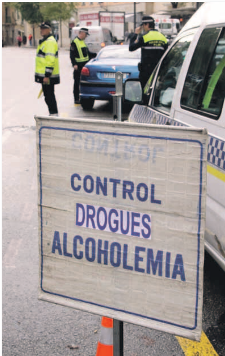
Control policial de alcohol y drogas

Los test salivales detectan a veces el rastro de sustancias consumidas con anterioridad al momento de la conducción