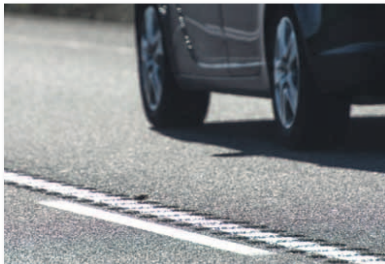
Bandas rugosas en el centro de la calzada

La Dirección General de Tráfico ha comenzado a instalar guías sonoras para la separación de sentidos de circulación en carreteras convencionales, una medida que va encaminada a evitar colisiones frontales y salidas de la vía, ya sea por distracciones, somnolencia u otros motivos. Según diversas investigaciones, entre las que se encuentran las realizadas por la Universidad de Aalborg (Dinamarca), o las del Departamento de Transportes de Estados Unidos, la iniciativa puede reducir los accidentes entre un 29 y un 67%. Esta medida supone una inver-