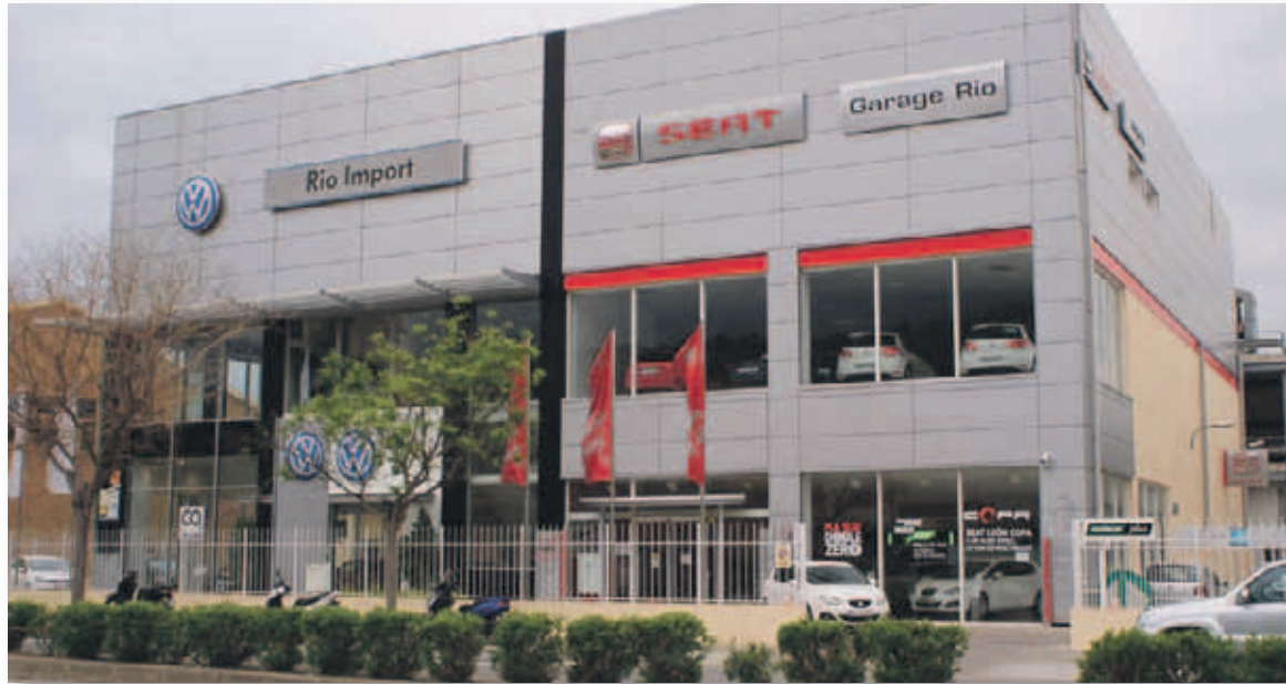
Las ventas de vehículos aportaron el 54% de la rentabilidad al concesionario

En un análisis por áreas de actividad, las ventas de vehículos aportaron el 54% de la rentabilidad al concesionario, lo que supone dos puntos porcentuales más que un año antes y el mejor resul-