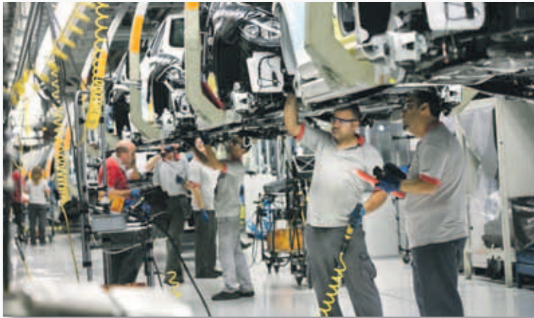
Nuestro país tiene 17 centros productivos de vehículos

Cada día salieron de las factorías españolas más de 7.800 vehículos