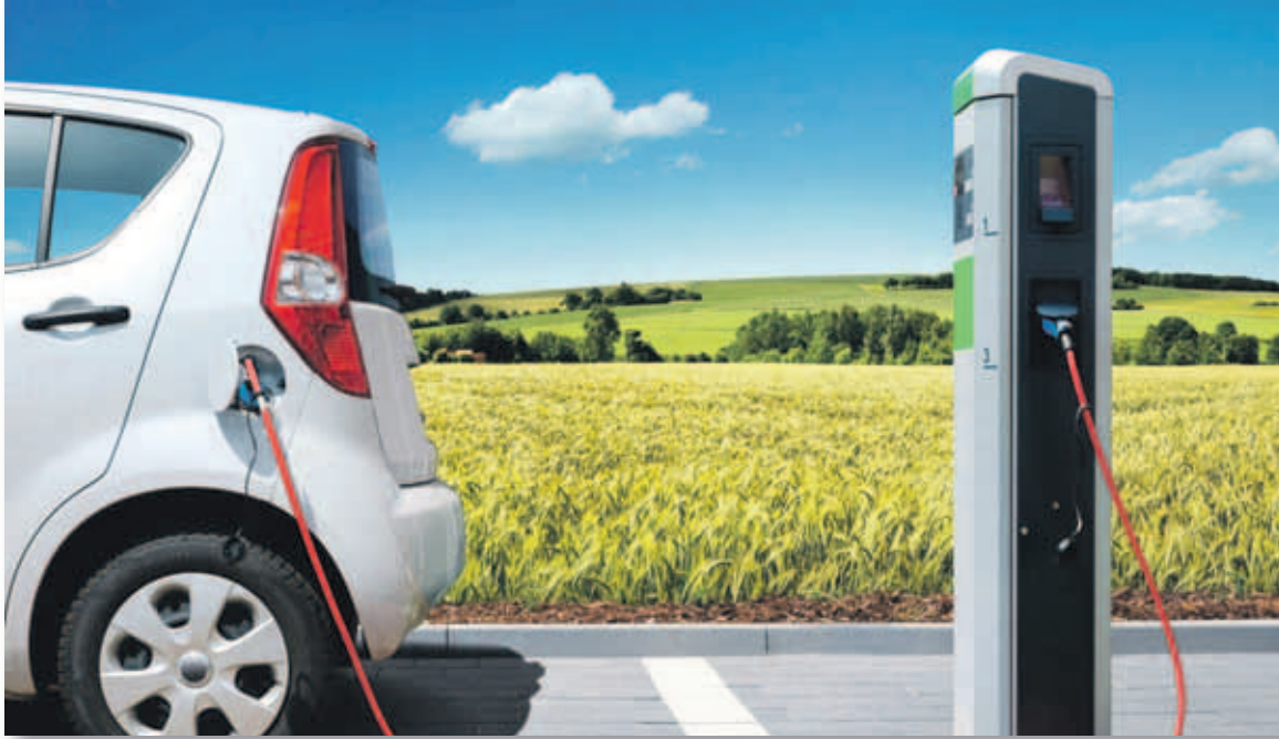
La reforma fiscal tratará de facilitar el acceso a vehículos cada vez más fiables, seguros y con menor impacto medioambiental

Hacienda asegura que la revisión no afectará a la recaudación de los ayuntamientos y las Comunidades