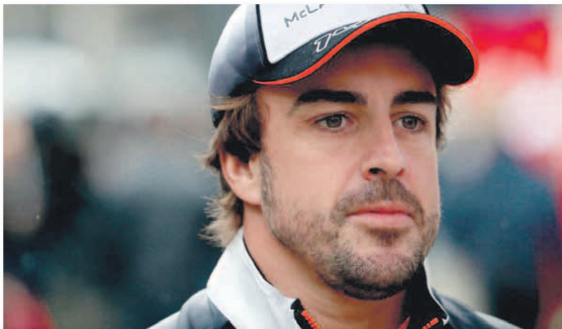
El cuello de Fernando Alonso mide unos 40 cm de circunferencia

Se arriesgan incluso a no poder entrar en el mono de carreras, algo