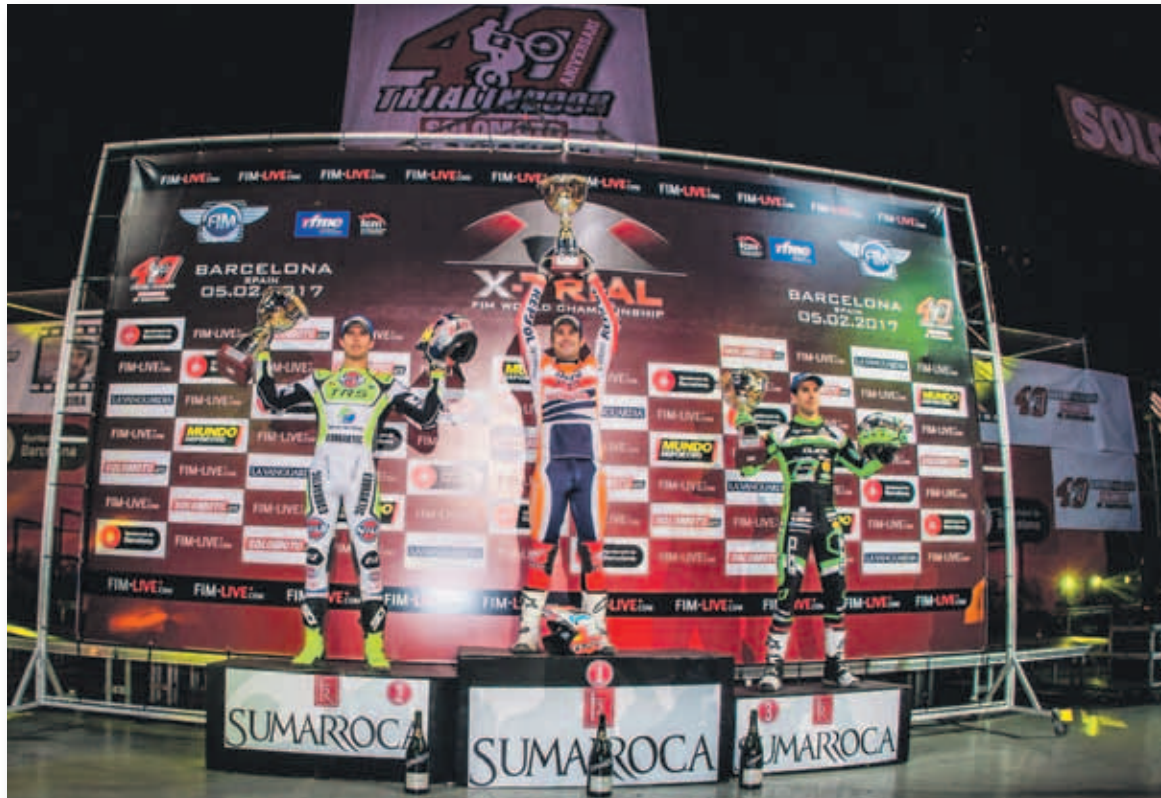
Podio del Trial indoor de Barcelona 2017

"Estoy muy contento por muchos motivos: por empezar el Mundial ganando, por hacerlo en Barcelona, por los 40 años de aniversario... Hay muchos motivos. La noche ha sido increíble y eso que he empezado con un error en la primera zona de la fase de clasificación. Pero me he podido recuperar y la final ha sido fantástica. La gente ha po-