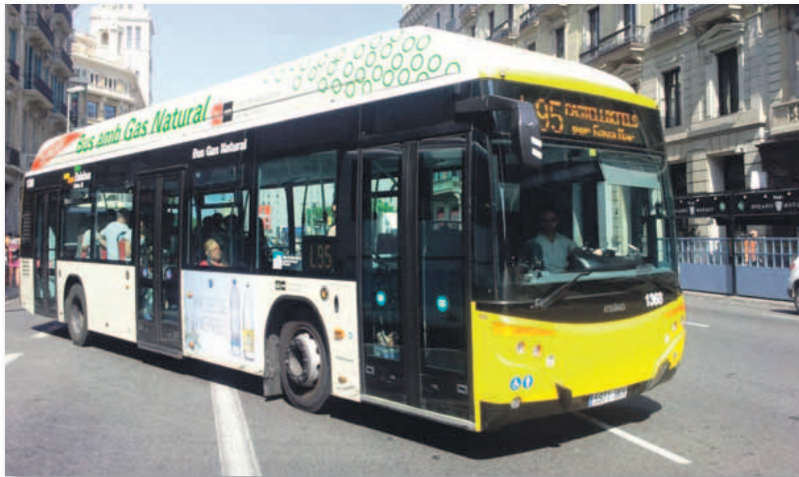
Autobús metropolitano de Barcelona impulsado por gas natural

En 2016 las ventas de vehículos impulsados por gas crecieron un 133%