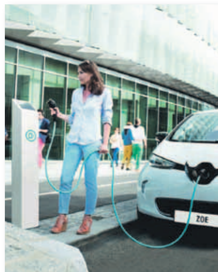
La falta planes de incentivo ralentiza el mercado de vehículos eléctricos

El mercado de vehículos híbridos y eléctricos (turismos, vehículos comerciales e industriales y autobuses) comienza el año con una notable subida de matriculaciones, alcanzando un total de 4.664 unidades. La cuota de mercado conjunta de estas dos tecnologías ha supuesto un 4,5% con respecto al total.