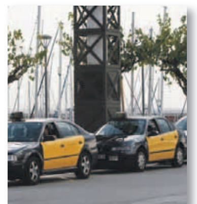
Barcelona té 10.523 llicències de taxi

Pel que respecta als taxis, la seva velocitat comercial diürna és variable en funció de la intensitat de trànsit però se situa a l'entorn dels