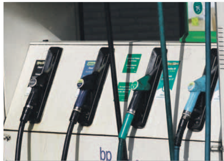
Surtidor de carburantes en una gasolinera

ciría en más gasto disponible para actuar contra el cambio climático, y por tanto en un mayor compromiso con la transición ecológica de la economía.