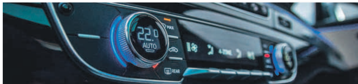
La temperatura ideal para viajes en el interior del coche está entre 22 y 24 grados

Un coche bien climatizado es el mejor aliado para viajar en verano, pero hay muchos conductores que no saben usar bien este elemento