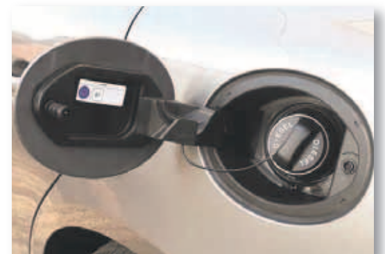
Etiquetas desde los derivados del petróleo, hasta los biocombustibles, pasando por el gas natural, entre otros.

Cuando los clientes lleguen a una estación de servicio y abran el tapón de llenado de combustible en su vehículo, un identificador de combustible común será visible tanto en el