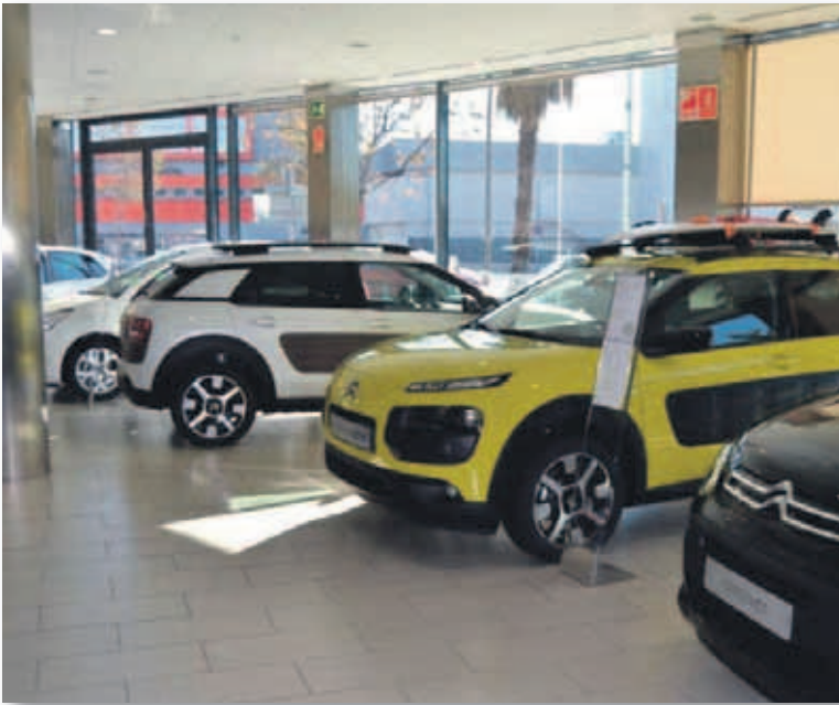
El canal de particulares ha registrado en junio un total de 61.377 matriculaciones

E l mes de junio registró un incremento de las entregas de turismos y todoterrenos del 8% respecto del mismo