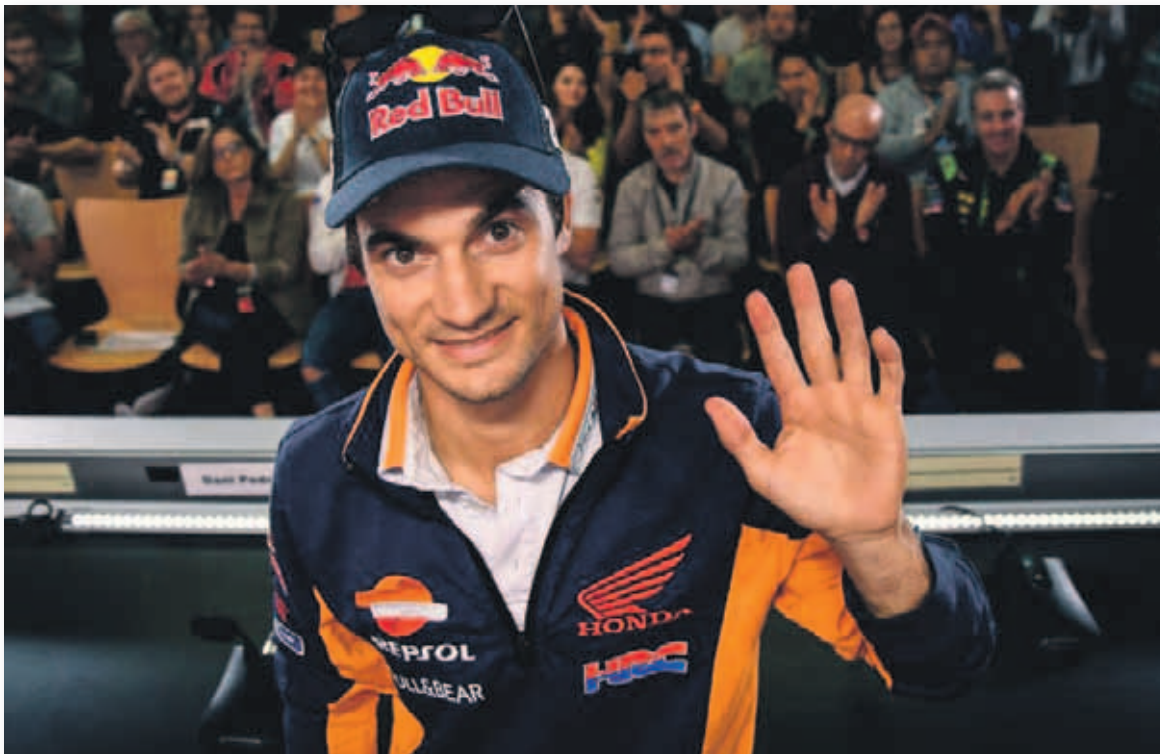
Dani Pedrosa, en la rueda de prensa en la que anunció su retirada de MotoGP

El piloto catalán anunció su retirada a la conclusión del presente Mundial de MotoGP