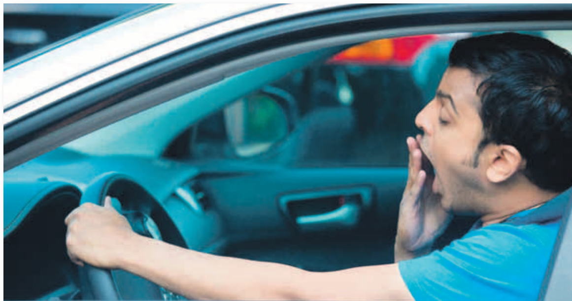
Sobre una muestra de 3.000 conductores señala que el 74% no para lo recomendado, y el 14% hace un viaje largo sin descanso.

La fatiga se manifiesta con síntomas como la pérdida de concentración, picor de ojos, visión borrosa, parpadeo constante, necesidad de moverse en el asiento, deshidratación y somnolencia. Sus