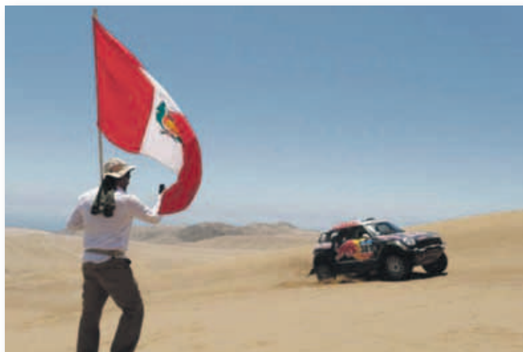
Un aficionado con la bandera de Perú sigue una etapa del Dakar 2018

Hace algo más de un mes se había conocido la noticia de que el Dakar 2019 se disputaría en su totalidad en suelo peruano después de no llegar a un acuerdo con el resto de países habituales como Argentina, Ecuador, Bolivia o Chile y que contaría con diez etapas. Esa era la hoja de ruta marcada, aunque luego por discrepancias en el seno del Gobierno peruano en cuanto a la política económica corrió serio peligro. Finalmente, el proyecto