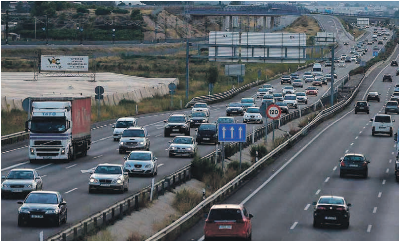
El Gobierno dice que trabajará especialmente por los colectivos más vulnerables como los motoristas, los ciclistas y los peatones

El Gobierno francés ha anunciado la rebaja del límite de velocidad en las carreteras secundarias de 90 a 80 km/h porque así espera evitar entre 350 y 400 muertes al año en accidentes de tráfico. El primer ministro, Edouard Philippe, recuerda que la velocidad "es sistemáticamente un factor agravante" de esos siniestros que se cobran cada año entre 3.500 y 3.600 vidas, a las que hay que sumar unos 75.000 heridos, de los cuales 25.000 quedan con lesiones "permanentes e irreversibles". No obstante, esas justificaciones no han impedido que la medida sea rechazada por tres cuartas partes de los franceses. Philippe asegura que habrá un "periodo inicial de pedagogía" donde serán más tolerantes en la aplicación del nuevo límite. De hecho, el ministro asegura que todavía se siguen calibrando los radares para detectar los excesos de velocidad.